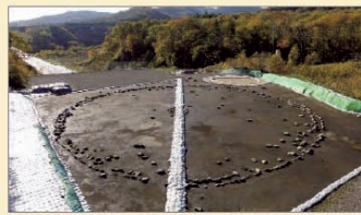
鷺ノ木遺跡(森町) ※関連資産