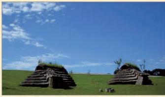
北黄金貝塚(伊達市)