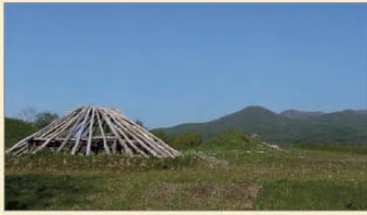
入江・高砂貝塚(洞爺湖町)