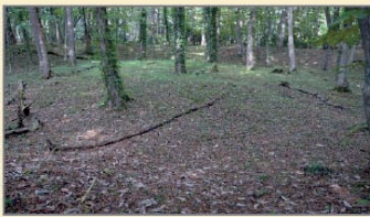
キウス同堤墓群(千歳市)