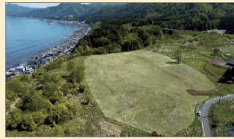
垣ノ島遺跡(函館市)