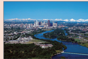
カルガリーの街並み