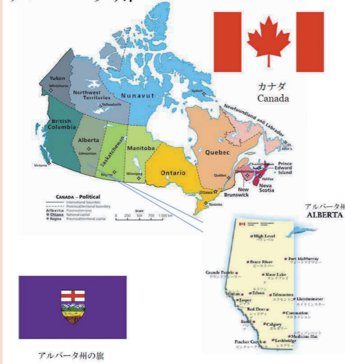
アルバータ州の旗