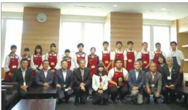
生徒の皆さんと議員の集合写真

令和2年9月7日、花き類の栽培に取り組んでいる「北海道当別高等学校園芸デザイン科」の生徒の皆さんから道議会に鉢花を贈呈していただきました。コロナ禍においても懸命に栽培してきた鉢花には「困難には負けない」というメッセージが込められ、生徒の皆さん自身での展示作業も行われました。