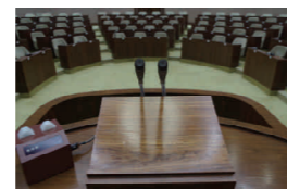
△演壇(本会議場質問席)