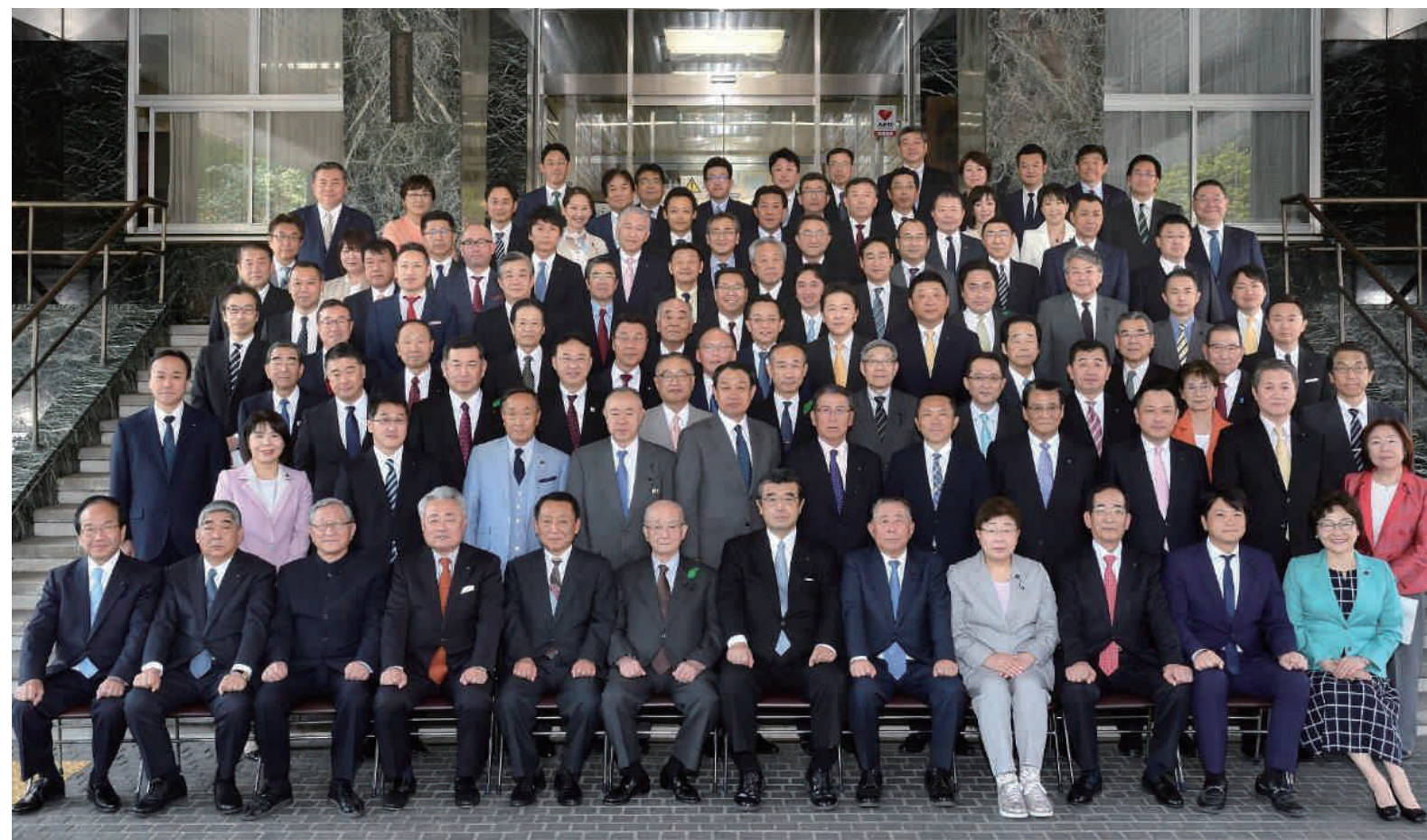
▲令和元年(2019年)5月16日撮影

平成31年(2019年)4月7日の道議会議員選挙で、100人の議員が選出されました。道議会の前身である道会時代の最初の議員から数えて、今回は第31期です。