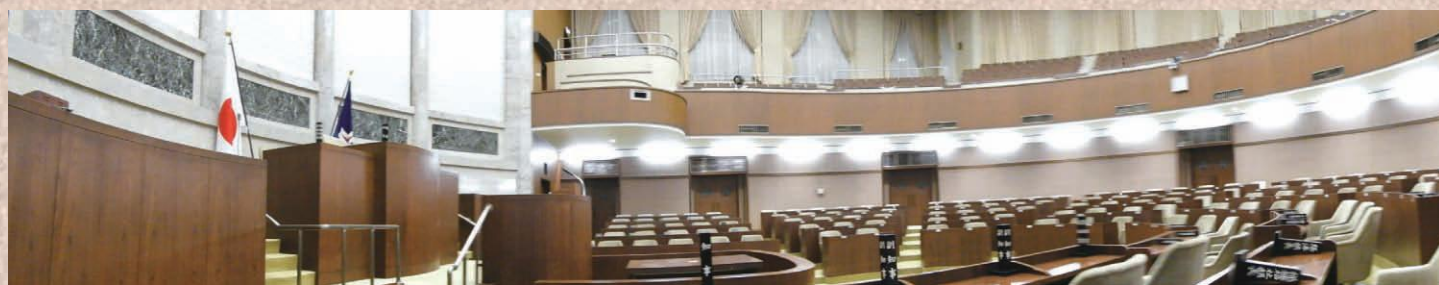
本会議場の知事席からの風景

【国際貿易交渉】 国際貿易交渉が進展する中、本道の農林水産業が持続的に発展していくように、どのように対応するかについて