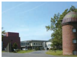
道立図書館入り口

当館には、約114万冊の 蔵書があり、個人の他、市町村 や大学の図書館などに本を貸 出しています。また、必要な本 を探したり、どんな本で調べ ればよいかといった 調べもの のお手伝い をしています。