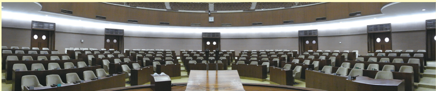
本会議場の演壇からの風景 ～質問者や答弁者からの目線～

【予算特別委員会での主な議論】 JR北海道路線見直し問題について関係機関が一体となった議論の推進について 道内各分野の企業における人手不足対策の実効性ある施策について 旧優生保護法のもとで本人の同意のない中で行われた不妊手術に対する情報提供体制等の整備について 教員の学校における働き方改革について