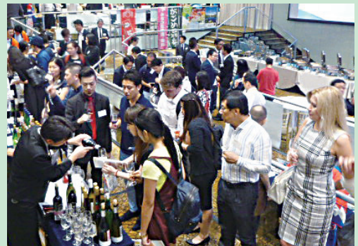
シンガポールで実施した商談会の様子（平成29年11月）

▶「キーワードをピックアップ!」や定例会に関する、意見、感想、質問をお寄せください。gikai.seisaku1@pref.hokkaido.lg.jp