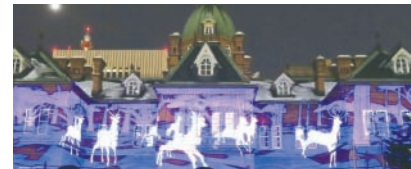
プロジェクションマッピング 赤れんが庁舎で開催（～2/25）