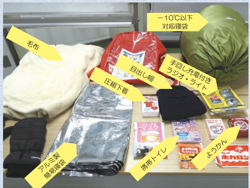
車内の防寒対策グッズ

暴風雪により、車のマフラーが雪で詰まる（埋まる）と、排気ガスが車内に逆流し、一酸化炭素により短時間で中毒死するおそれがあります。そのためエンジンを停止しなければなりません。ただし、車内がとても冷えるため防寒対策が必要です。