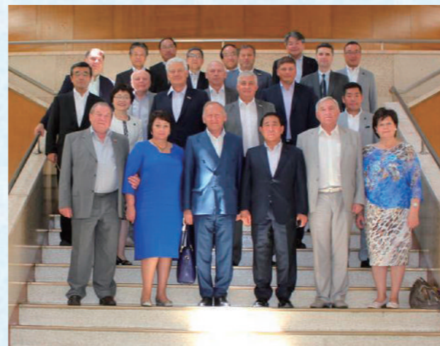
議会庁舎にて記念撮影