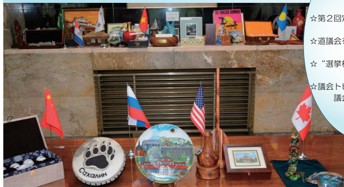
国際交流時に道議会へ贈呈された記念品の一部